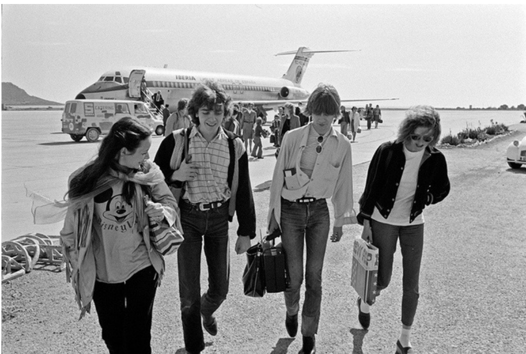
Atterrissage , gelatine silver print, 70's, 30 x 40 cm, unique ed.