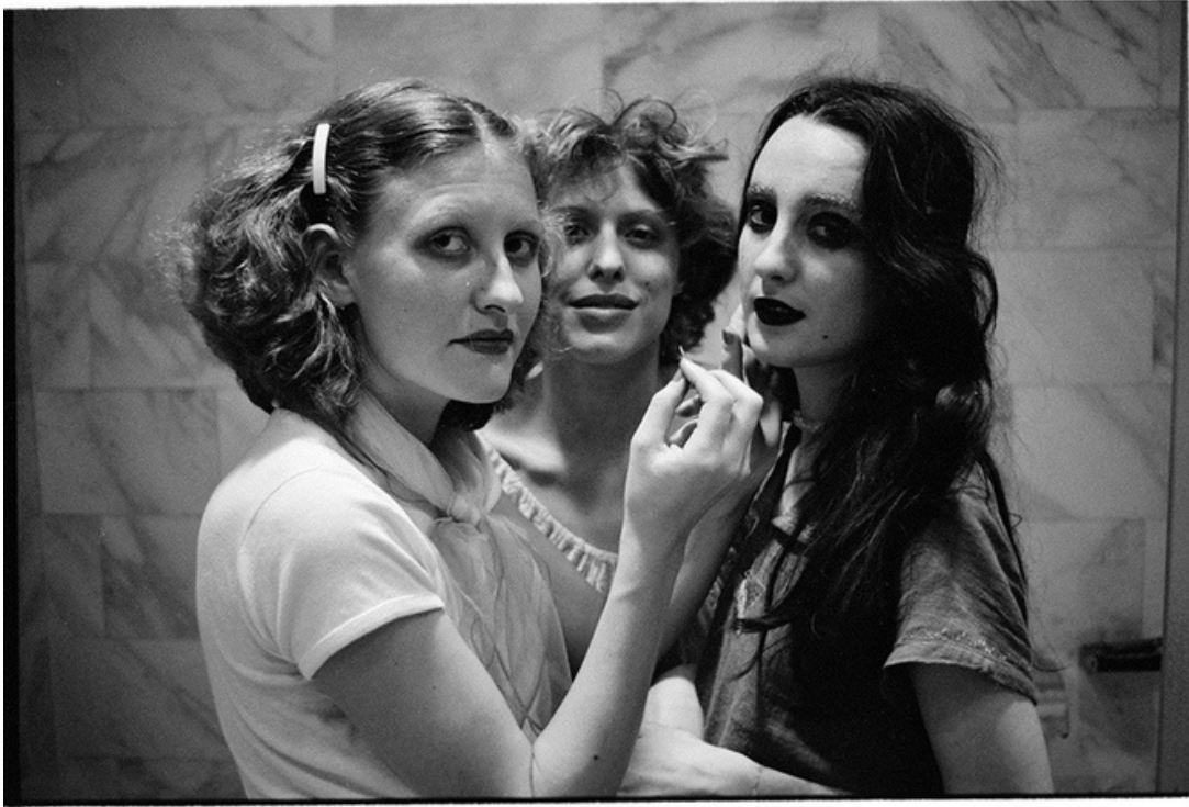
Trois , gelatine silver print, 70's, 30 x 40 cm, unique ed.