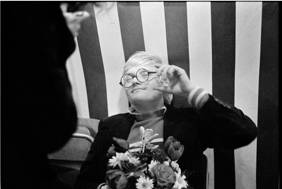
David Hockney , gelatine silver print, 70's, 30 x 40 cm, unique ed.