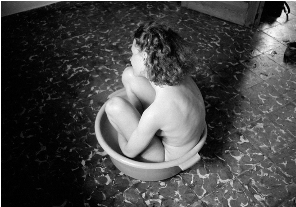
La baigneuse , gelatine silver print, 70's, 30 x 40 cm, unique ed.