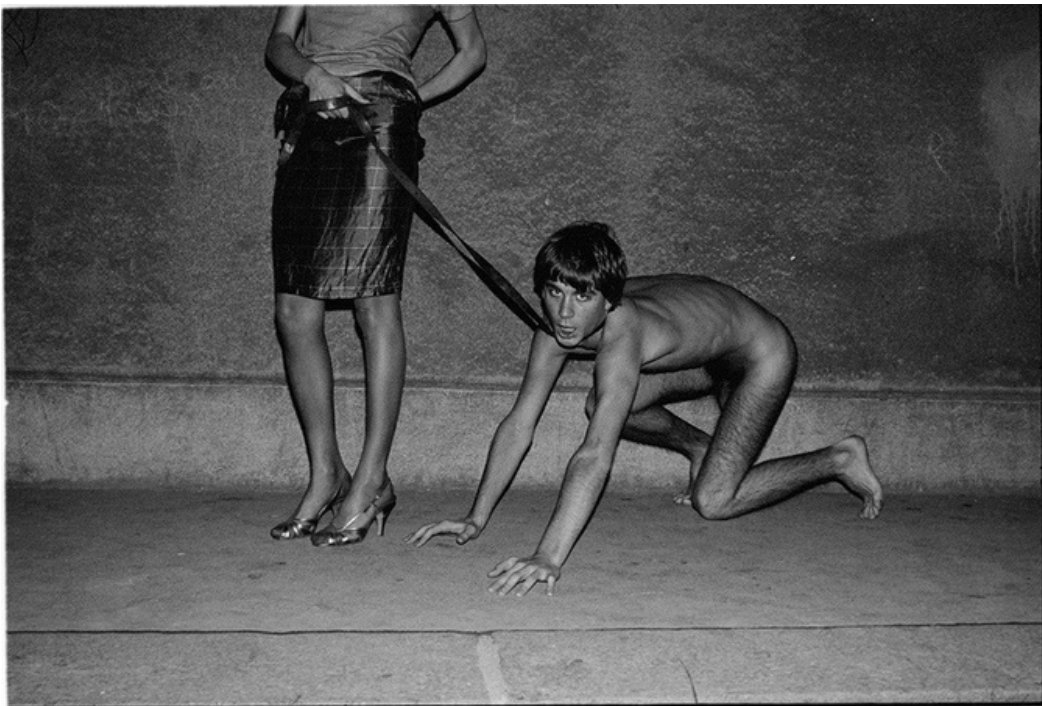
Promenade , gelatine silver print, 70's, 30 x 40 cm, unique ed.