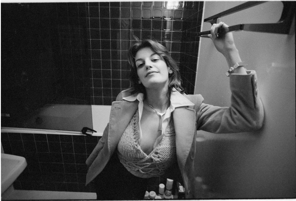
Nel mio bagno , gelatine silver print, 70's, 30 x 40 cm, unique ed.