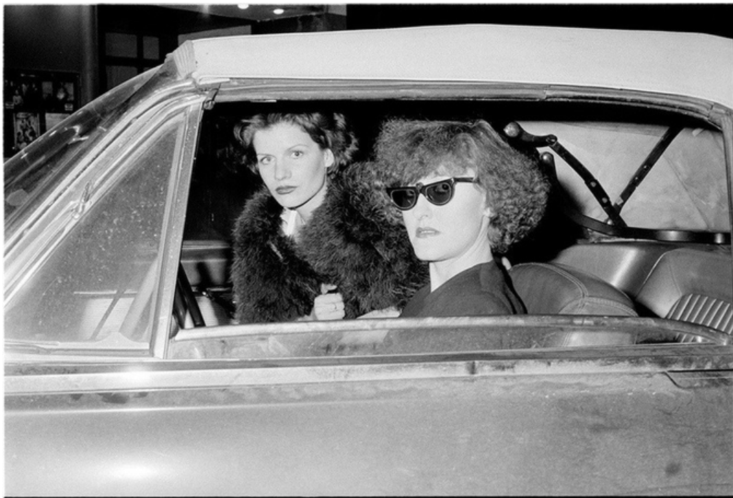
Diva , gelatine silver print, 70's, 30 x 40 cm, unique ed.