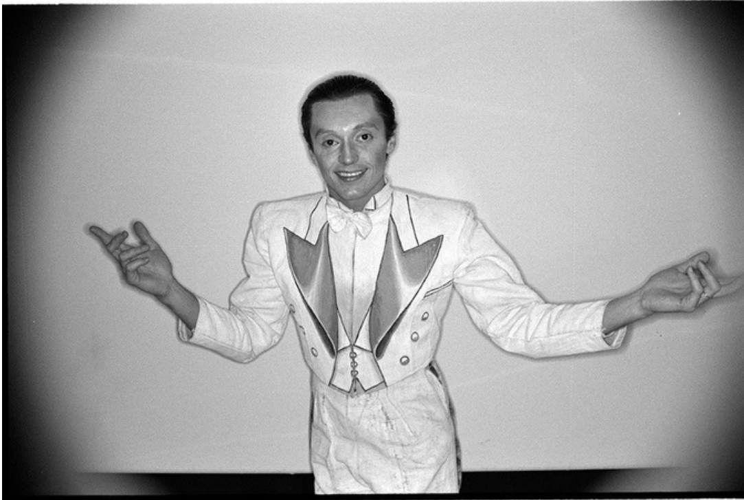
Francois Wimille , gelatine silver print, 70's, 30 x 40 cm, unique ed.