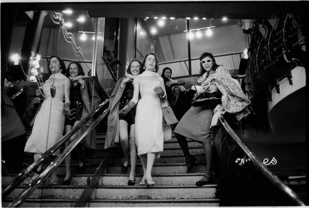
Les filles , gelatine silver print, 70's, 30 x 40 cm, unique ed.