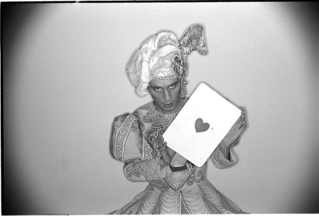
Mattia Bonetti , gelatine silver print, 70's, 30 x 40 cm, unique ed.