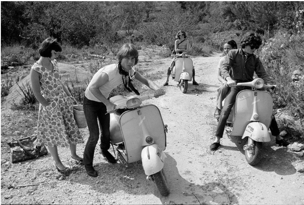
Ibiza grand tour , gelatine silver print, 70's, 30 x 40 cm, unique ed.