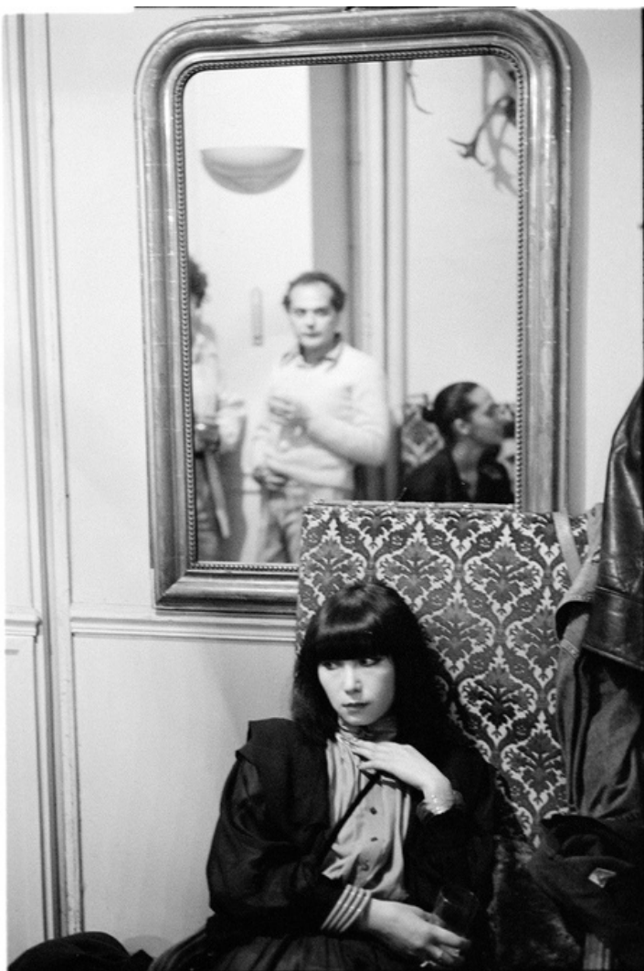
Interieur , gelatine silver print, 70's, 40 x 30 cm, unique ed.