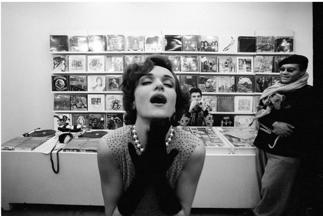
Marie - France , gelatine silver print, 70's, 30 x 40 cm, unique ed.