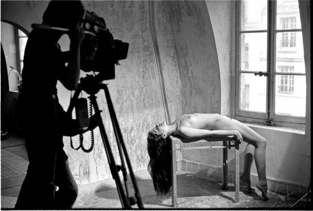
Nue , gelatine silver print, 70's, 30 x 40 cm, unique ed.