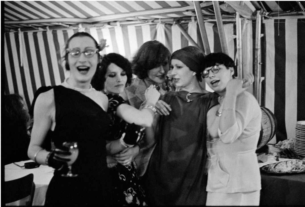
Mes Dames , gelatine silver print, 70's, 30 x 40 cm, unique ed.