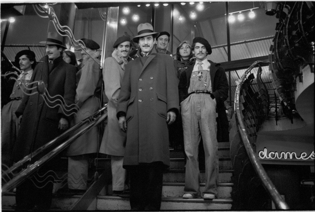
Les garçons , gelatine silver print, 70's, 30 x 40 cm, unique ed.