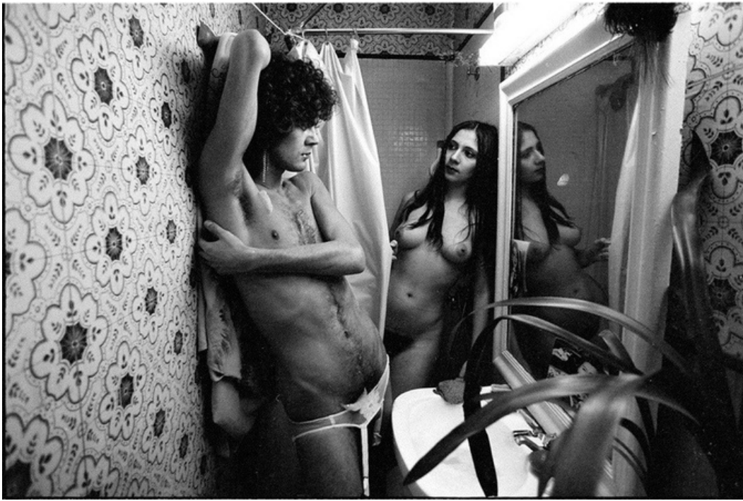
Regards , gelatine silver print, 70's, 30 x 40 cm, unique ed.