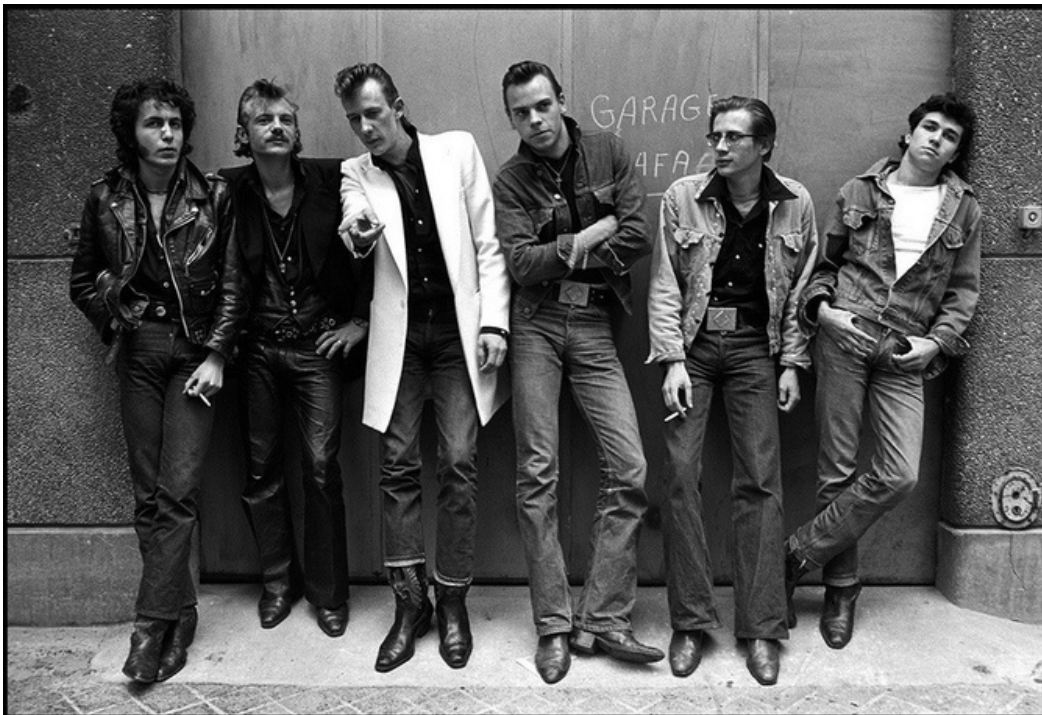
Gene Vincent fans club , gelatine silver print, 70's, 30 x 40 cm, unique ed.