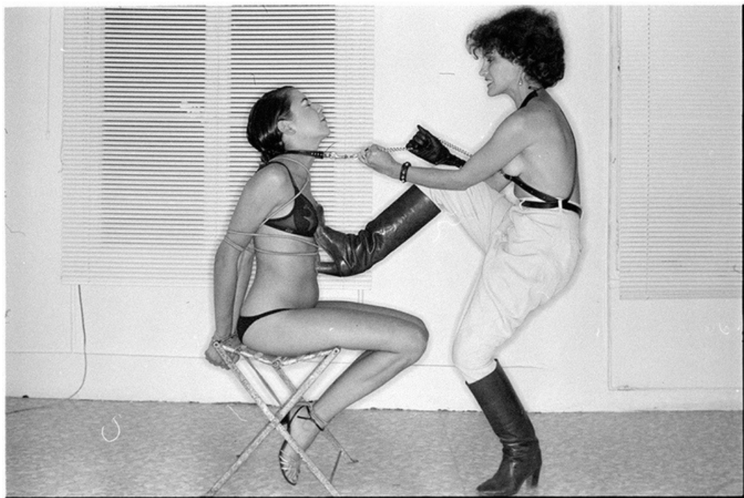
Elle s'amuse , gelatine silver print, 70's, 30 x 40 cm, unique ed.