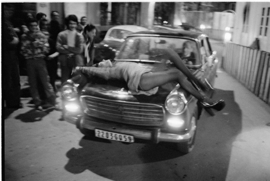
Après '68 , gelatine silver print, 70's, 30 x 40 cm, unique ed.