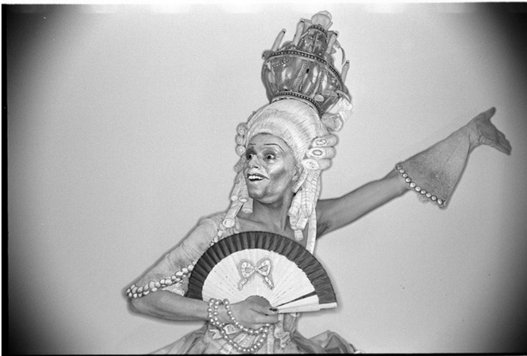
David Rocheline , gelatine silver print, 70's, 30 x 40 cm, unique ed.